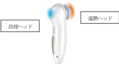
[図 1 温熱Wヘッド イメージ]